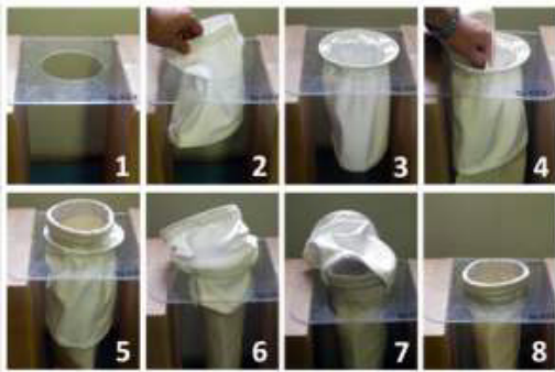
Montaje de la manga utilizando un "calcetín" protector.

Respuestas para una producción industrial más sostenible y respetuosa con el Medioambiente.