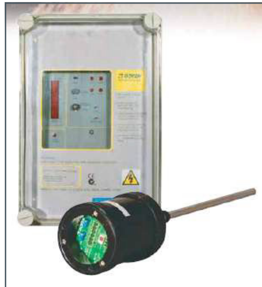
Goyen EMP6B, de Pentair, comercializado en España por ICT FILTRATION.

Los instrumentos para controlar de forma continua las emisiones de partículas en la corriente de gas, como los desarrollados por Pentair, son la respuesta a esta necesidad transversal del sector industrial. La firma estadounidense propone dos modelos de alta fiabilidad, que serán los encargados de detectar una emisión por rotura de manga o cualquier otra causa y emitir aviso de alarma.