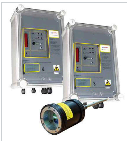
Goyen BBD6B, de Pentair, comercializado en España por ICT FILTRACIÓN.

Es importante resaltar que ambos dispositivos cumplen la normativa ATEX II 3 D&G. En el caso del modelo EMP6B, también MACT.