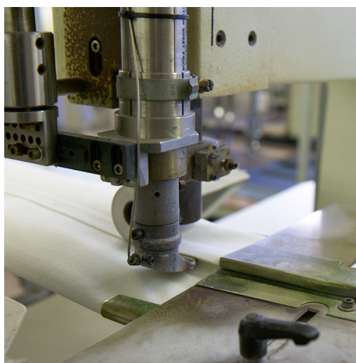
Boquilla emisora de aire caliente