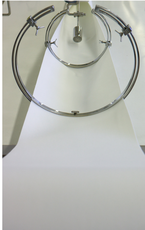
Guía del termosoldado