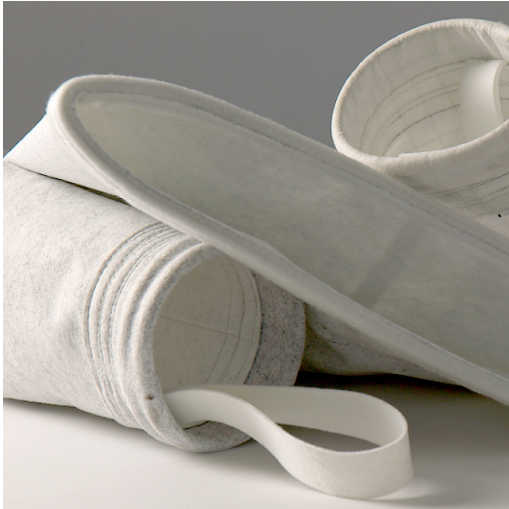
Mangas y bolsas con costuras termosoldadas

Respuestas para una producción industrial más sostenible y respetuosa con el Medioambiente.